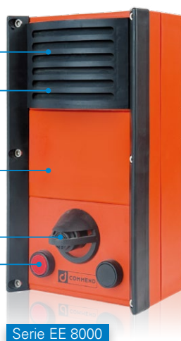
Serie EE 8000